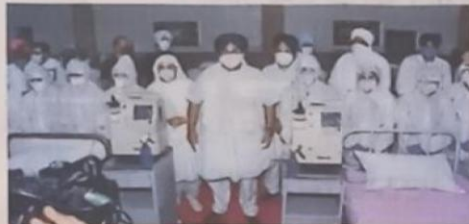
ਕੋਵਿਡ ਕੇਅਰ ਸੈਂਟਰ ਦਾ ਉਦਘਾਟਨ ਕਰਨ ਸਮੇਂ ਸ਼੍ਰੋਮਣੀ ਦੇ ਪ੍ਰਧਾਨ ਸੁਖਬੀਰ ਸਿੰਘ ਬਾਦਲ ਤੇ ਹੋਰ ਅਕਾਲੀ ਆਗੂ।

ਸ਼੍ਰੋਮਣੀ ਅਕਾਲੀ ਦਲ ਦੇ ਪ੍ਰਧਾਨ ਸੁਖਬੀਰ ਸਿੰਘ ਬਾਦਲ ਨੇ ਸਨਿਚਰਵਾਰ ਨੂੰ ਬੁਢਲਾਡਾ ਵਿਖੇ ਮੁੱਖ ਮੰਤਰੀ ਕੈਪਟਨ ਅਮਰਿੰਦਰ ਸਿੰਘ ਨੂੰ ਸਲਾਹ ਦਿੰਦਿਆਂ ਕਿਹਾ ਕਿ ਉਹ ਕੋਰੋਨਾ ਸੈਂਟਰ ਨਾਲ ਨਜਿੱਠਣ ਲਈ ਮੰਤਰੀਆਂ ਦੀ ਇਜ਼ਾਜ਼ਤ ਡਿਊਟੀਆਂ ਲਗਾਉਣ ਤੋਂ ਇਲਾਵਾ ਮੰਤਰੀਆਂ ਨੂੰ ਦਵਾਈਆਂ ਤੇ ਆਕਸੀਜਨ ਦੇ ਨਾਲ ਮਿਲਾਕੇ ਸਿਹਤ ਸੰਭਾਲ ਸਕਦੇ ਹਨ। ਬਾਦਲ ਇਥੇ ਸ਼੍ਰੋਮਣੀ ਕਮੇਟੀ ਵੱਲੋਂ ਬਣਾਏ ਆਕਸੀਜਨ ਕੰਸਨਟ੍ਰੇਟਰਾਂ ਨਾਲ ਲੈਸ 25 ਬੈੱਡਾਂ ਵਾਲੇ ਕੋਰੋਨਾ ਕੇਅਰ ਸੈਂਟਰ ਦਾ ਉਦਘਾਟਨ ਕਰਨ ਪੁੱਜੇ ਹੋਏ ਸਨ। ਇਸ ਮੌਕੇ ਸ਼੍ਰੋਮਣੀ ਗੁਰਦੁਆਰਾ ਪ੍ਰਬੰਧਕ ਕਮੇਟੀ ਦੇ ਪ੍ਰਧਾਨ ਬੀਬੀ ਜਗੀਰ ਕੌਰ ਨੇ ਦੱਸਿਆ ਕਿ ਸ਼੍ਰੋਮਣੀ ਵੱਲੋਂ ਸੂਬੇ 'ਚ ਖੋਲ੍ਹਿਆ ਗਿਆ ਇਹ ਛੋਟਾ ਕੋਰੋਨਾ ਕੇਅਰ ਸੈਂਟਰ ਹੈ ਅਤੇ ਆਉਂਦੇ ਦਿਨਾਂ 'ਚ ਹੋਰ ਅਜਿਹੇ ਸੈਂਟਰ ਖੋਲ੍ਹੇ ਜਾਣਗੇ। ਬਾਦਲ